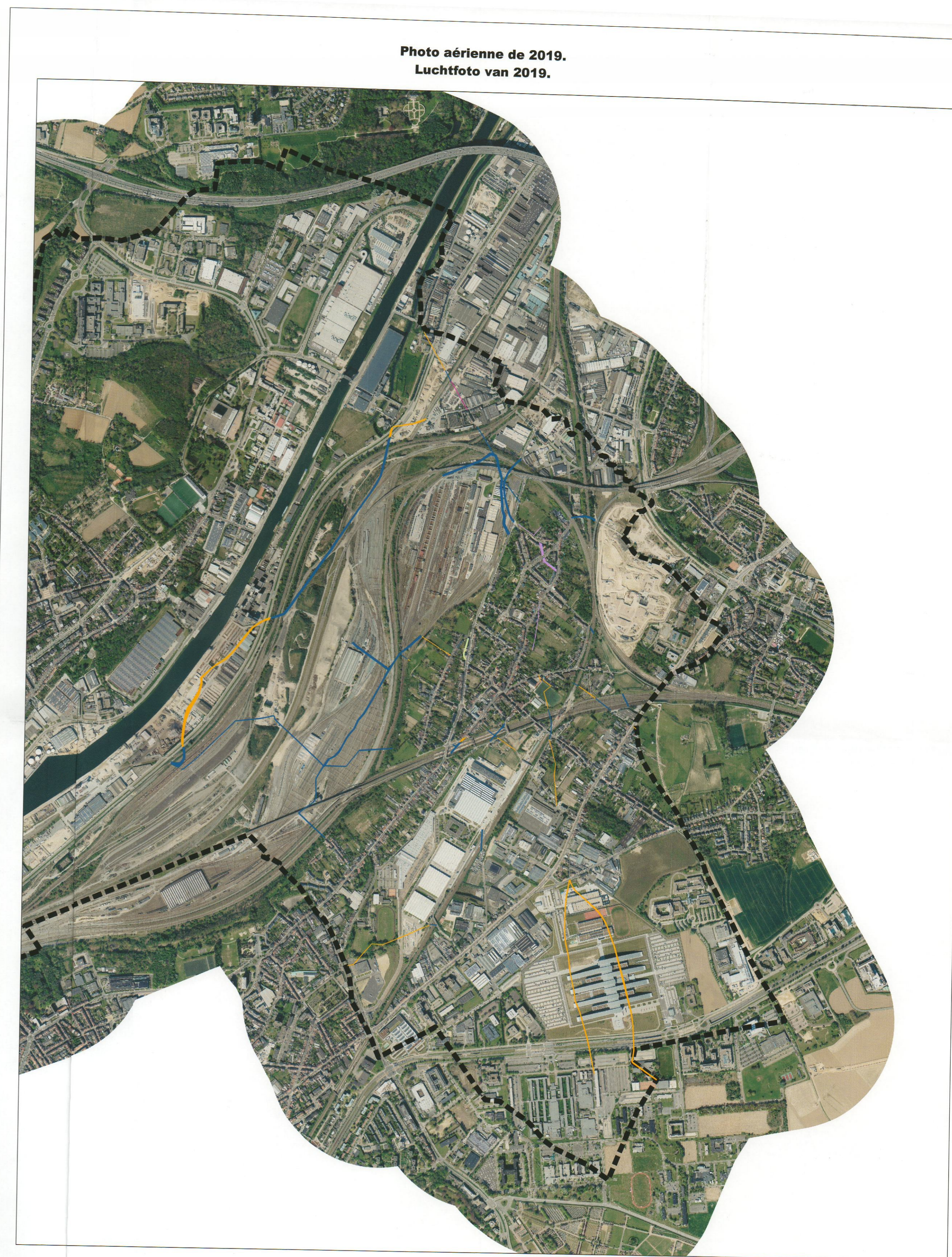
Photo aérienne de 2019. Luchtfoto van 2019.